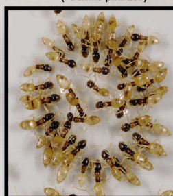
Tapinoma melanocephalum (Fourmis fantôme)