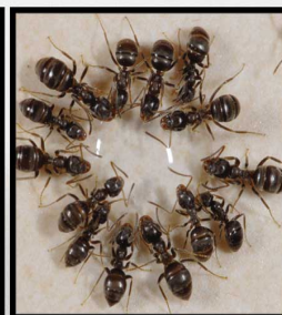
Lasius niger (Fourmis noires)