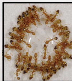
Monomorium pharaonis (Fourmis pharaon)