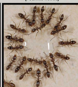
Linepithema humile (Fourmis d'Argentine)